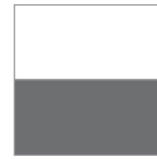
Hvid/lys grå TO